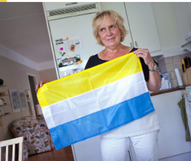
Den tornedalska flaggan är gul - som solen, vit - som snön och blå - som himlen.