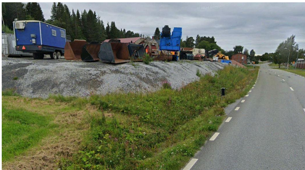
Bild mot väster längs väg 344 mot Hammerdals centrum

Risken för ras och skred bedöms som liten eftersom planområdet lutar svagt mot norr. Grundvattennivån ligger på mellan 2 och 8 m. Berggrunden består av Bituminös lerskiffer (alunskiffer) och underordnat kalksten och metamorfa ekvivalenter. Marktäcket ner till berg (ca: 3-8 m) utgörs av lerig morän.