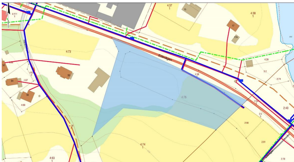
Utdrag från fastighetskartan. Planområde markerat i blått