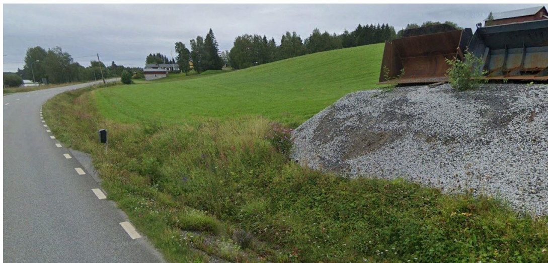
Bild mot öster längs väg 344