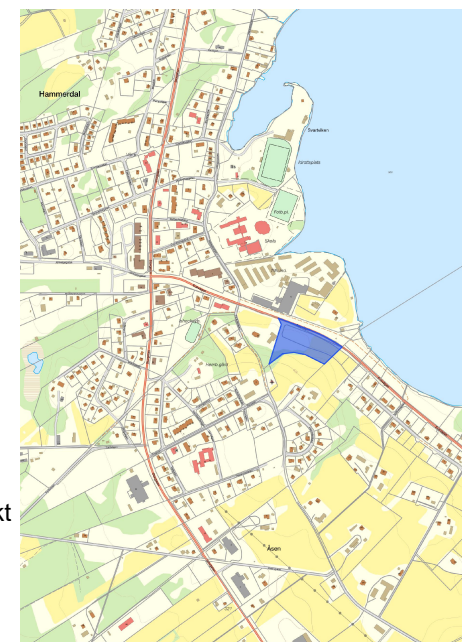
ÖVERSIKTSKARTA PLANOMRÅDE MARKERAT I BLÅTT