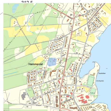
Översiktskarta Planområde markerat i blått