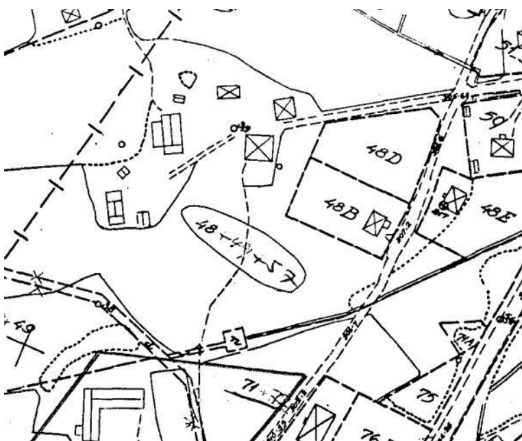
Gårdsbild innan reglering, utdrag från akt 23-HAS-177.

Planområdet ligger ganska centralt inom Hammerdals samhälle, väster om europaväg 45, ca: 3 mil söder om Strömsund. Området ingår i byggnadsplan B 76 Hammerdals samhälle västra Mo-området stg 48, Mo 1:20, 1:70 m.fl. Syftet med planen är att genom förrättning återskapa den gårdsbild som förelåg innan reglering och planläggning.