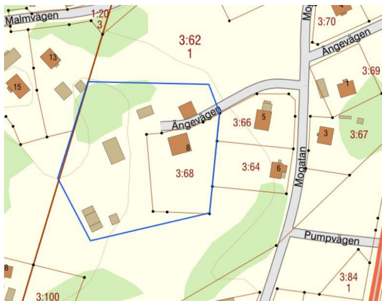
Utdrag från fastighetskartan. Planområde markerat i blått